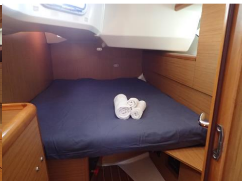
“Selene” sun odyssey 49